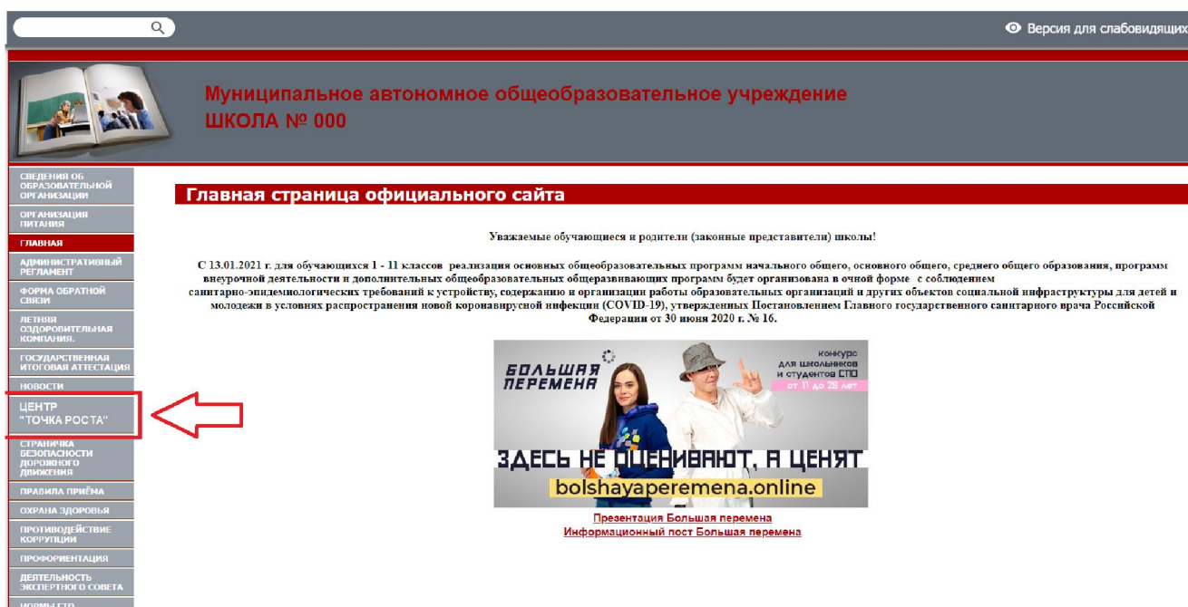
Рисунок 2. Пример размещения ссылки на раздел на сайте общеобразовательной организации

На официальном сайте общеобразовательной организации, в которой создается центр образования естественно-научной и технологической направленностей «Точка роста» (далее – центр «Точка роста», центр) в рамках федерального проекта «Современная школа» национального проекта «Образование», не позднее даты начала функционирования центра (не позднее 1 сентября года создания центра) создается раздел «Центр «Точка роста». Ссылка на раздел размещается в главном меню сайта общеобразовательной организации и должна быть видима при просмотре каждой страницы. Ссылка не может являться вложенной в другие меню. Пример размещения ссылки на раздел «Центр «Точка роста» в меню официального сайта общеобразовательной организации в информационно-телекоммуникационной сети «Интернет» приведен на рисунке 2.